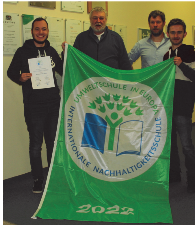
Wir freuen uns sehr über die erneute Auszeichnung!

Allen Akteur:innen (Lehrerinnen und Lehrer, Schülerinnen und Schüler), die von der Planung über die Durchführung bis hin zur Auszeichnung beteiligt waren, gilt unser herzlichster Dank – und natürlich ganz besonders auch unseren „Energiebeauftragten“ in den Klassen. Ihr macht das ganz hervorragend! (Th)